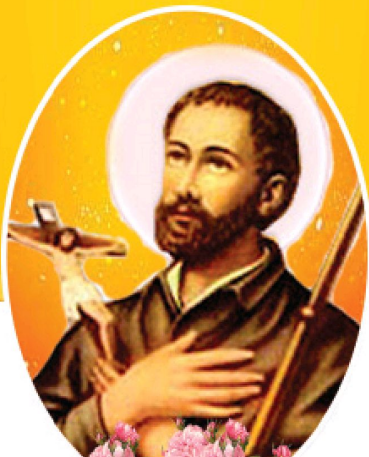
വിശുദ്ധ ഫ്രാൻസിസ് സേവ്യർ