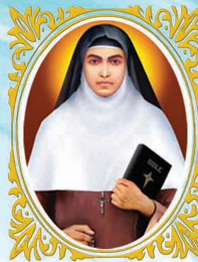
വി. അൽഫോൻസാമ്മേ ഞങ്ങൾക്കുവേണ്ടി അപേക്ഷിക്കണമേ