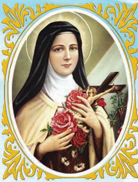
വി. കൊച്ചുത്രേസ്യായേ ഞങ്ങൾക്കുവേണ്ടി അപേക്ഷിക്കണമേ