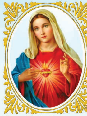
മറിയത്തിന്റെ വിമല ഹൃദയമേ ഭാരതത്തിനുവേണ്ടി പ്രാർത്ഥിക്കണമേ