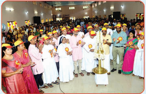
മെറുപുഷ്പ മിഷൻലീഗ് കാൺസിൽ ഉദ്ഘാടനം - കരുണാപുരം