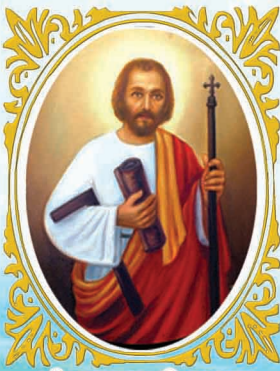
വി. തോമാശ്ലീഹായേ ഞങ്ങൾക്കുവേണ്ടി അപേക്ഷിക്കണമേ