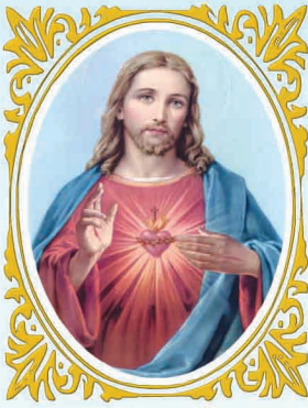
ഈശോയുടെ പരി. ഹൃദയമേ അങ്ങയുടെ രാജ്യം വരണമേ