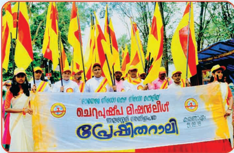
മെറുപുഷ്പ മിഷൻലീഗ് അതിരൂപതാ വാർഷികം - പ്രേഷിതാലി - കരുണാപുരം