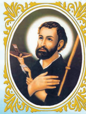
വി. ഫ്രാൻസിസ് സേവ്യറേ ഞങ്ങൾക്കുവേണ്ടി അപേക്ഷിക്കണമേ