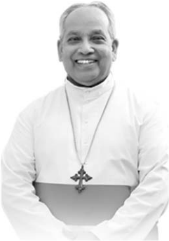
മാർ ജോർജ്ജ് വലിയമറ്റം പ്രാർത്ഥനാ നിർഭരമായ വിശ്രമജീവിതം നേരുന്നു...