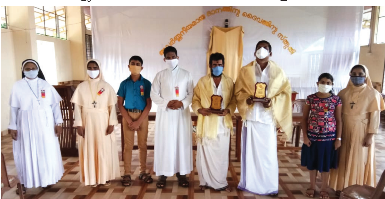
തളിപ്പറമ്പ് മേഖല കർഷകനെ ആദരിച്ചപ്പോൾ