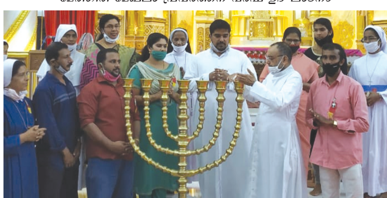
ആലക്കോട് മേഖല പ്രവർത്തന വർഷ ഉദ്ഘാടനം

ക്രിസ്മസ് കരോൾ യാത്രകൾ എന്നും ഹരമായിരുന്നു. കുട്ടിക്കാലത്ത്, ഇടവക കരോൾ സംഘങ്ങൾ എണ്ണത്തിൽ കുറവും ആൾബലംകൊണ്ട് ആകർഷകവുമായിരുന്നു. ക്രിസ്മസ് ദിവസം വൈകിട്ടാരംഭിക്കുന്ന കരോൾ യാത്രകൾ പിറ്റേന്ന് പുലർച്ചെവരെ നീണ്ടു പോയിരുന്നു. കൊടും തണുപ്പിൽ കൂട്ടായ്മയുടെ ചൂടിൽ മുന്നേറുന്ന കരോൾ യാത്രകൾ സുഖമുള്ള ഓരോർമ്മയാണ്. സ്കൂൾ പഠനകാലത്താണ്... കരോൾ യാത്രയിൽ രസകരമായ ഒരു സംഭവമുണ്ടായി ഇരുപതിലധികം കുട്ടികൾ സംഘത്തിലുണ്ട്, ഊഴം വെച്ച് ഞങ്ങൾ കുട്ടികൾ തന്നെയാണ് തിരുസമ്പ്രദായം വഹിച്ചിരുന്നത്. മുറ്റത്ത് മനോഹരമായി പുൽക്കൂട് തീർത്ത ഒരു വീട്ടിലെ സന്ദർശനവും കാപ്പികുടിയും കഴിഞ്ഞ് കുറച്ച് ദൂരകൂട്ടലുള്ള മറ്റൊരു വീട്ടിൽ സംഘം എത്തിയപ്പോഴാണ് ഉണ്ണിയേക്കു കൂടെയില്ല എന്നുള്ള സത്യം മനസ്സിലാവുന്നത്. അതുവരെ രൂപം എടുത്തിരുന്ന കുട്ടിയോട് അന്വേഷിച്ചപ്പോൾ, കഴിഞ്ഞ വീടു മുതൽ മറ്റൊരാളെ ഏൽപ്പിച്ചിരുന്നു എന്നു മറുപടി. ഏറ്റെടുത്ത ആളെ നോക്കിയപ്പോൾ അയാൾ