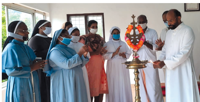
മേരിഗിരി മേഖല പ്രവർത്തന വർഷ ഉദ്ഘാടനം