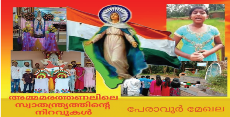
അമ്മമരത്തണലിലെ സ്വാതന്ത്ര്യത്തിന്റെ നിറവുകൾ പേരാവൂർ മേഖല