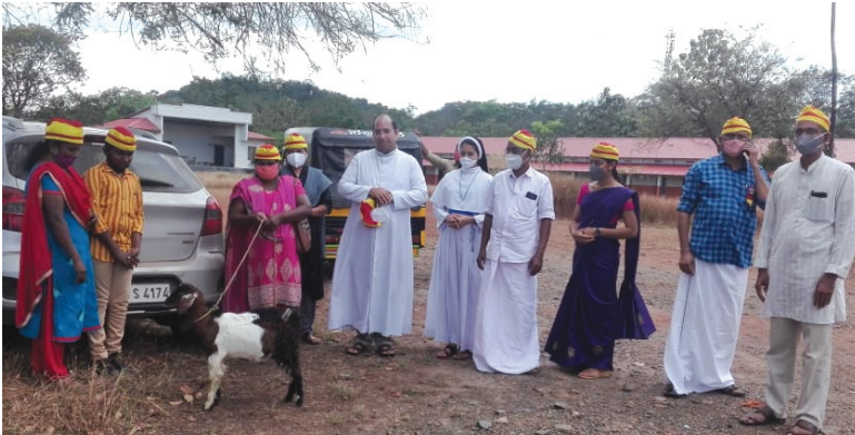
നെല്ലിക്കാപൊയിൽ മേഖല നല്ലയിടൻ പദ്ധതി ആട് വിതരണം