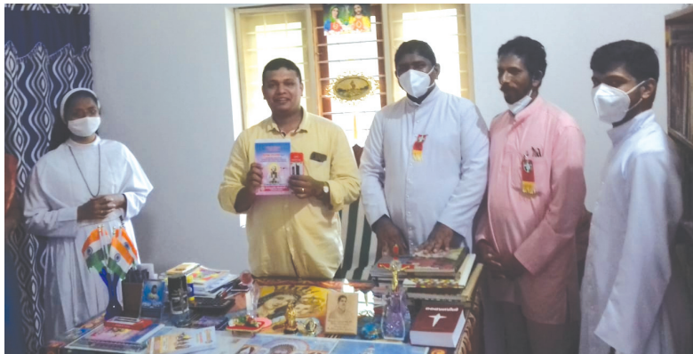
ചെമ്പേരി മേഖല മാർഗ്ഗരേഖ പ്രകാശനം