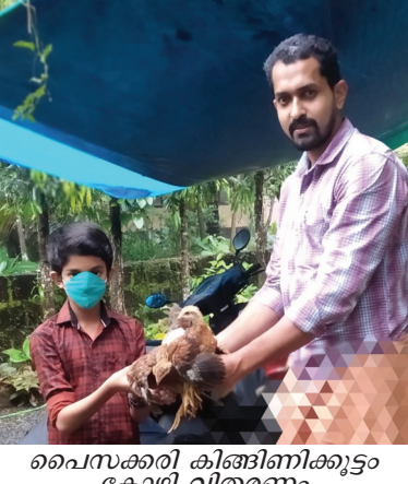
പൈസക്കരി കിങ്ങിണിക്കൂട്ടം കോഴി വിതരണം

ഞെന്ന് രാജാക്കന്മാർ തിരിച്ചറിഞ്ഞ് പൊന്നും മീനയും കുന്തിരിക്കവും കാഴ്ചവെക്കുന്നു... സൈന്യബലത്തിൽ ശക്തനായ ലോകത്തിന്റെ രാജാവ്-ഹെറോദോസ്-പിറന്നു വീണ ആ ശിശുവിനെ ഭയക്കുന്നു. തുടർന്ന് നൂറുകണക്കിന് ശിശുക്കളെ വധിക്കുന്നു.... നാടിന്റെ ആ നിലവിളിയും നൂറ്റാണ്ടുകൾക്ക് മുൻപ് രേഖപ്പെടുത്തി വയ്ക്കുന്നു. വരുവാനിരിക്കുന്ന സകല ജനത്തിനും അപ്പമായി തീരേണ്ടവൻ അപ്പത്തിന്റെ ഭവനം എന്നർത്ഥം വരുന്ന ബെത്ലെഹെമിൽ ജനിക്കുന്നു. തന്റെ ജീവിതത്തിൽ അവൻ നൽകിയ സകല വാഗ്ദാനങ്ങളും നിറവേറ്റിക്കൊണ്ട് അവൻ ഇന്നും ജീവിക്കുന്നു.... നിത്യജീവന്റെ അപ്പമായ്.... പുട്ടി മുദ്രവച്ച കല്ലറയും പൊതിഞ്ഞ കച്ചയും പകുത്തു നൽകിയ തന്റെ ശരീരവും പരീക്ഷണ നിരീക്ഷണങ്ങൾക്ക് വിധേയമാക്കി ശാസ്ത്രവും പറയുന്നു ഇവൻ ഇമ്മാനുവേൽ-ദൈവം നമ്മോടു കൂടെ-അവൻ ഇന്നും ജീവിക്കുന്നു. അവനാണ് ലോകരക്ഷകൻ ഈ ഓർമ്മപ്പെടുത്തലാകട്ടെ ഓരോ ക്രിസ്മസും.