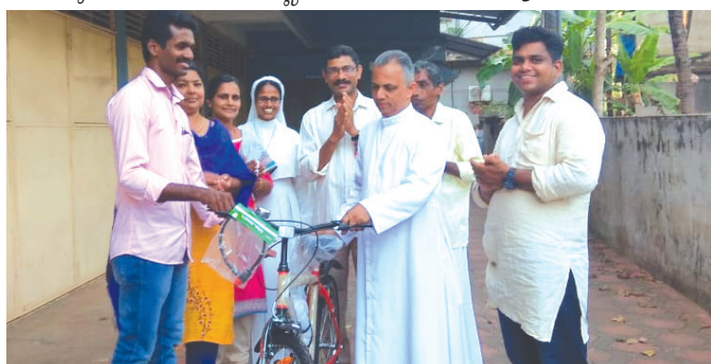
കാഞ്ഞങ്ങാട് മേഖല സൈക്കിൾ വിതരണം