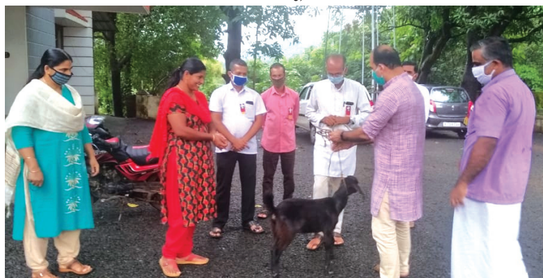
കുന്നോത്ത് മേഖല നല്ലയിടൻ പദ്ധതിയിൽ ആട് വിതരണം