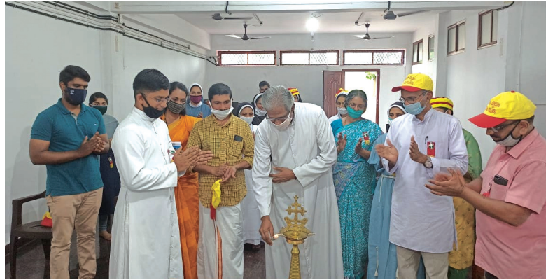
എടുർ മേഖല പ്രവർത്തന വർഷ ഉദ്ഘാടനം