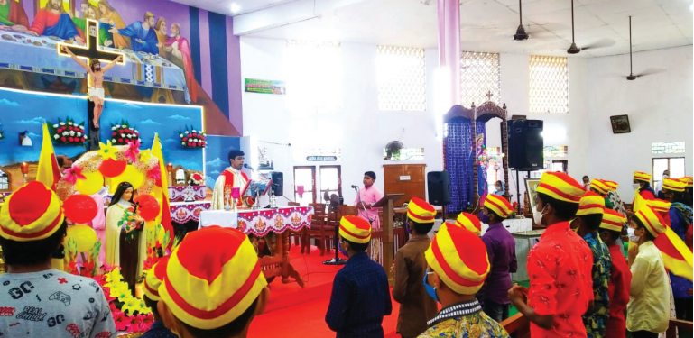
അതിരൂപതാ തലം ഒക്ടോബർ 01