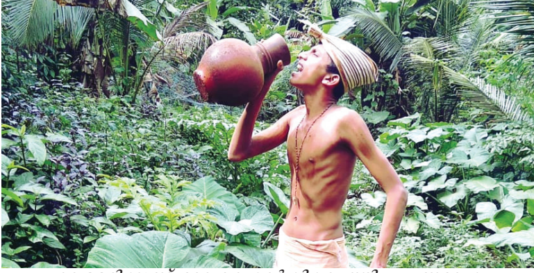
വെള്ളരിക്കുണ്ട് മേഖല കാർഷികവൃത്തി പ്രചാരണ മത്സരത്തിൽനിന്ന്