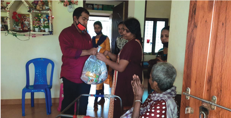
പനത്തടി മേഖല ഓണകിറ്റ് വിതരണം