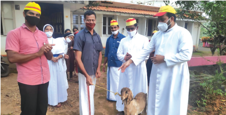
തോമാപുരം മേഖല നല്ലയിടൻ പദ്ധതി