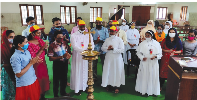
വായാട്ടുപറമ്പ് മേഖല പ്രവർത്തന വർഷ ഉദ്ഘാടനം